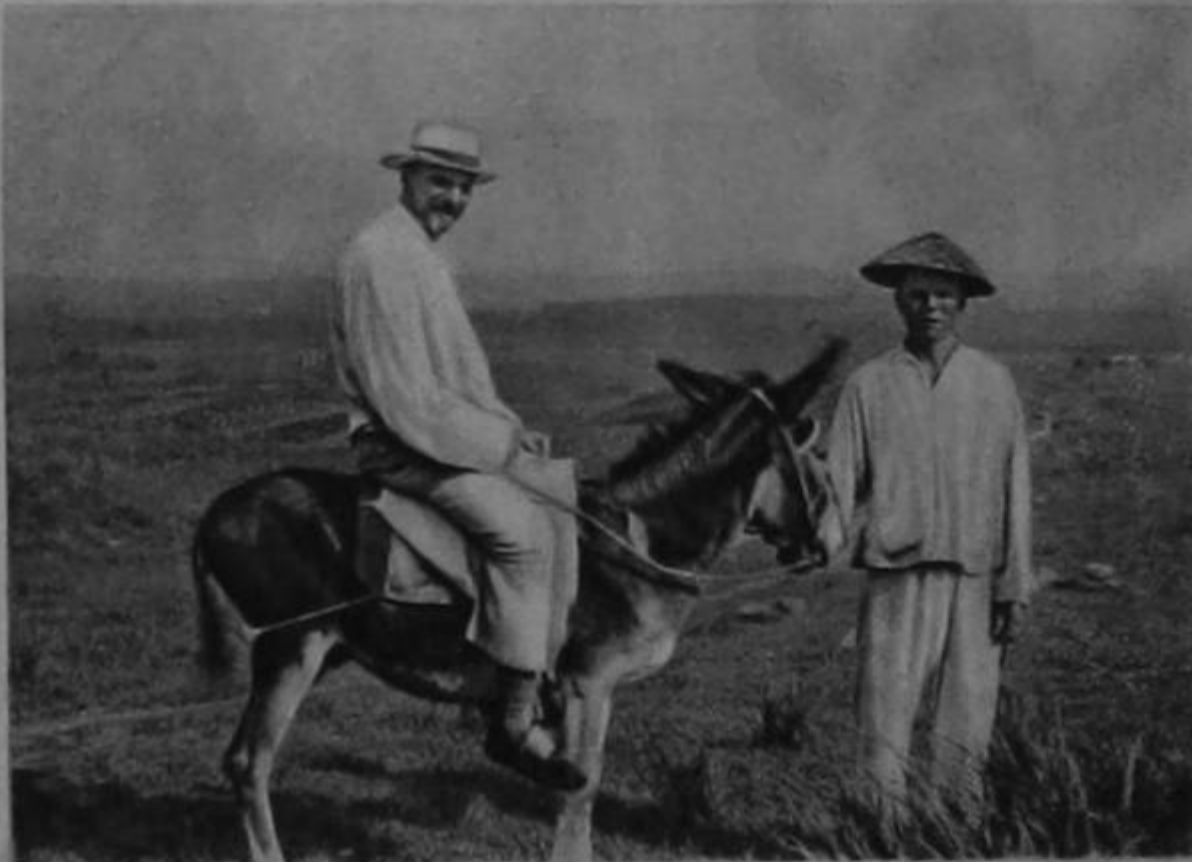
El Salvador del mundo, personificado en los misioneros, ha recorrido en todos los sentidos, durante el transcurso de los siglos, el campo de las Misiones. ¡Y con cuántas fatigas y privaciones!