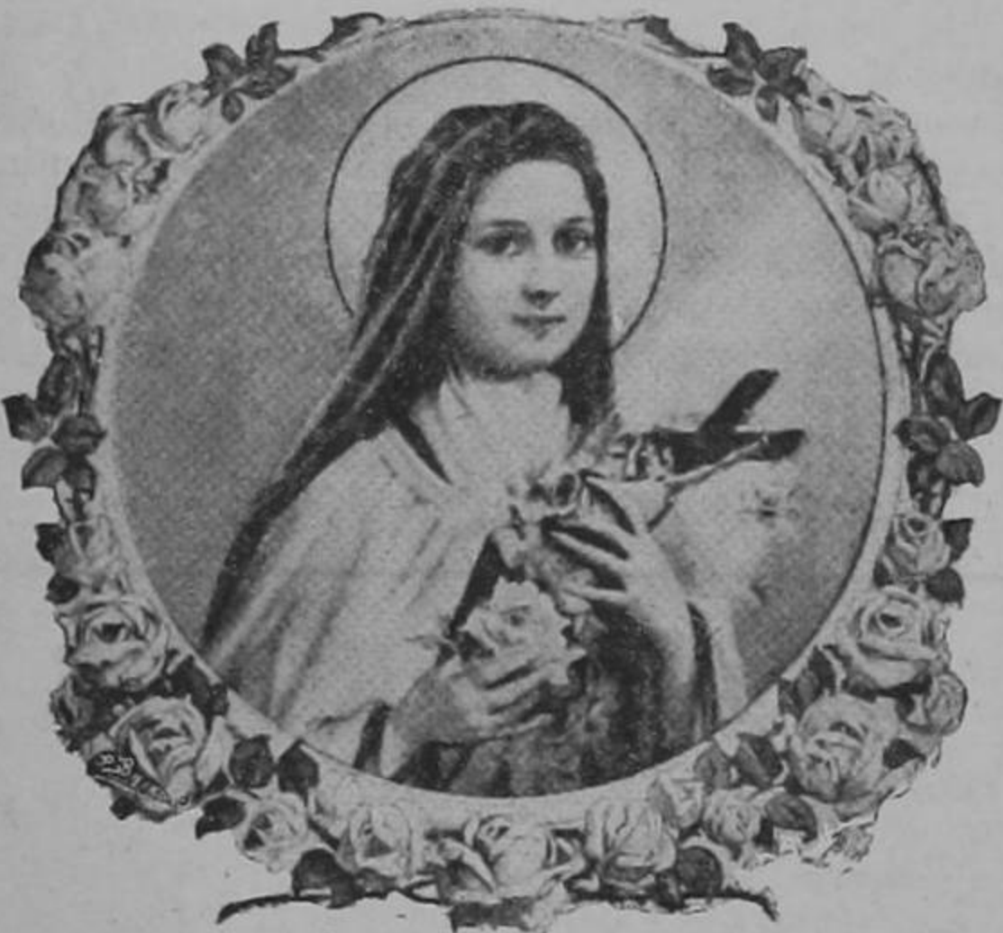
Santa Teresita del Niño Jesús

rubia, y los largos rizos quedan tan naturales y bien hechos como el mismo día en que cambió la galanura de su pelo, por la sencilla y humilde toca de novicia. Pero, lo que más conmueve, a pesar de que «fueron muy pocas las penitencias corporales que hizo fuera de la Regla, por haberle hecho comprender el Espíritu Santo, que santifica incomparablemente más la mortificación del espíritu y del corazón»... es un cilicio. Y, más allá un hábito, uno de los hábitos que en vida