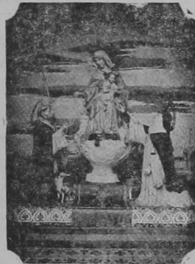
Nuestra Señora del Rosario