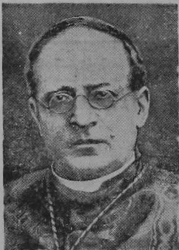
El Papa Pío XI, que condena con las palabras de Cristo el crimen de la guerra y conjura a todos los hombres de buena voluntad

Por segunda vez desde que ha recrudecido el conflicto italo-etiope, que amenaza desencadenar una conflagración mundial, el Papa se ha dirigido al mundo para exhortar a las naciones a la paz. Ante 2000 enfermeras, que en representación de 27 naciones fueron a solicitar su bendición, condenó la guerra de conquista de que se habla... Los términos de la alocución papal dentro de la vaguedad que deben tener—no siendo un poder temporal y político—son más precisos que los de los propios diplomáticos.