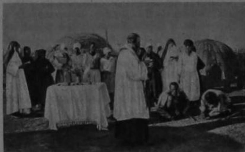
Estos dos ancianos, que convenientemente preparados por las Hermanas Benedictinas reciben el bautismo, son indígenas del Vicariato de Eshowen, de Africa del Sur.

HUECOGRABADO RIVADENEYRA, S. A. Paseo de San Vicente, 20. MADRID